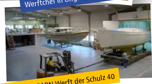
AVENTURA UNGARN Werft der Schulz 40