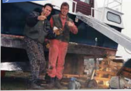
Arbeiten am Unterwasserschiff mit selbstgebaute Slipwagen auf Autofelgen