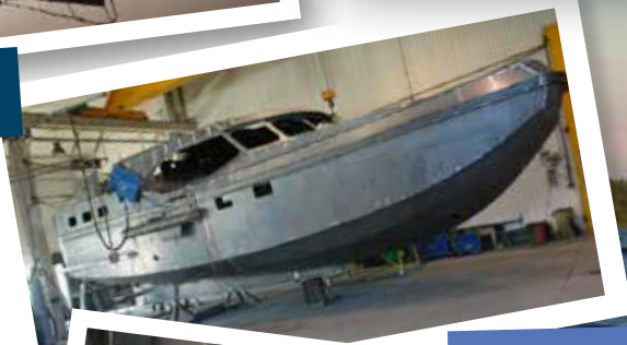
Neubau der Schulz40