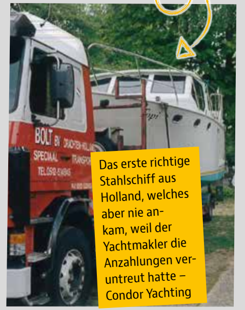
Das erste richtige Stahlschiff aus Holland, welches aber nie ankam, weil der Yachtmakler die Anzahlungen veruntreut hatte