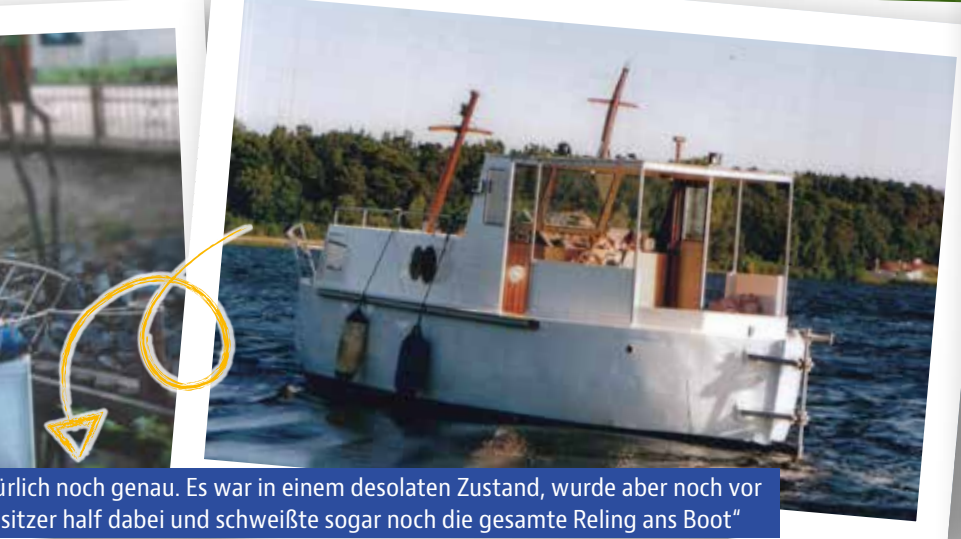
ürlich noch genau. Es war in einem desolaten Zustand, wurde aber noch vor sitzer half dabei und schweißte sogar noch die gesamte Reling ans Boot"