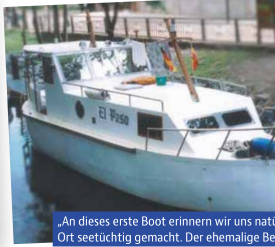
„An dieses erste Boot erinnern wir uns natürlich seetüchtig gemacht. Der ehemalige Be