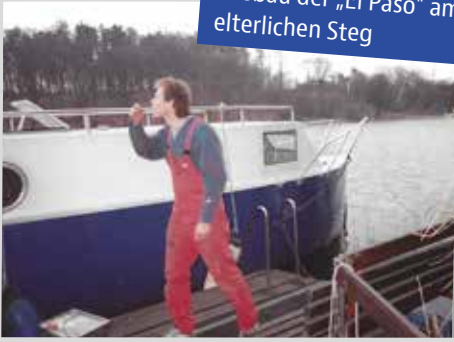
Arbeiten am Unterwasserschiff mit selbstgebaute Slipwagen auf Autofelgen