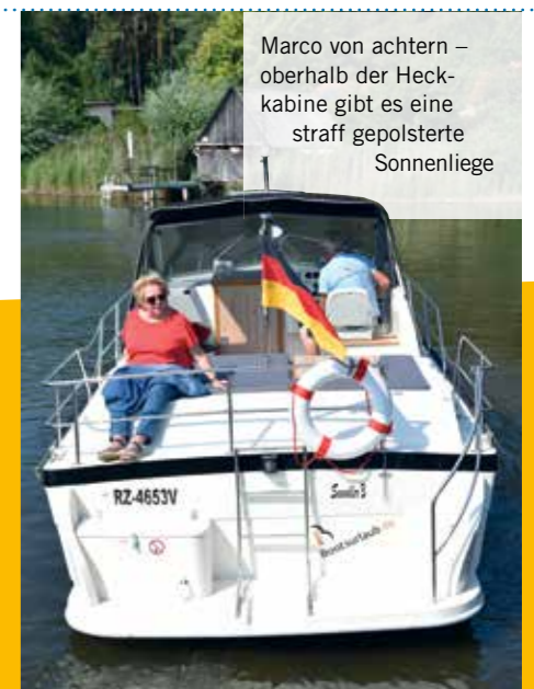
Marco von achtern – oberhalb der Heckkabine gibt es eine straff gepolsterte Sonnenliege